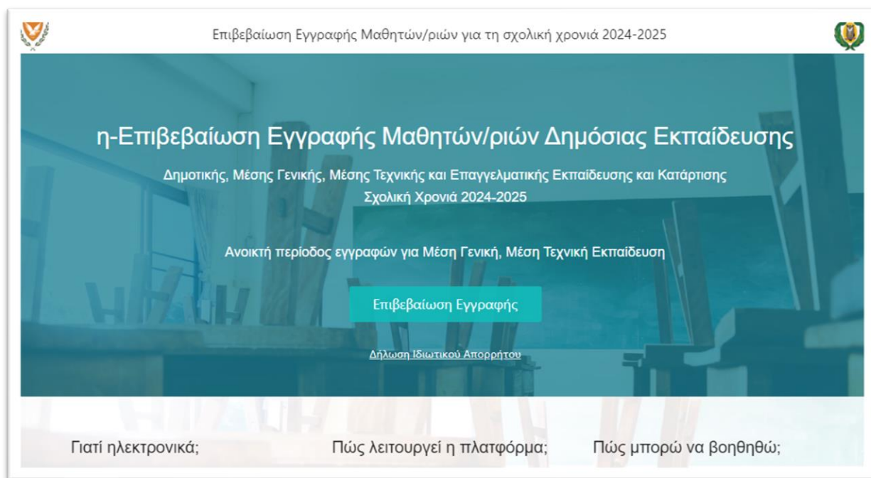
Εικόνα 1 - ηΕπιβεβαίωση Εγγραφής Μαθητών/ριών

Η Πύλη ηΕπιβεβαίωσης Εγγραφών θα είναι προσβάσιμη από τους γονείς/κηδεμόνες των μαθητών/ριών που θα φοιτήσουν τη νέα σχολική χρονιά 2024-2025, στη Β΄ ή Γ΄ τάξη Γυμνασίου/Λυκείου/Τεχνικών Σχολών , στη διεύθυνση https://engrafes.moec.gov.cy/ , ώστε να μπορούν να επιβεβαιώσουν ηλεκτρονικά την εγγραφή των παιδιών τους, κατά τις ημερομηνίες που αναφέρονται στη σχετική ανακοίνωση.